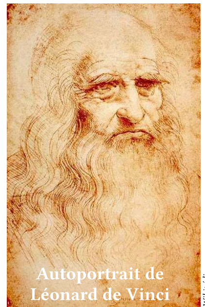
Autoportrait de Léonard de Vinci

Ce tableau a été volé en 1911, puis retrouvé ensuite. Il est aujourd'hui l'une des œuvres d'art les plus visitées au monde. On pense qu'il y a environ 20 000 visiteurs par jour.