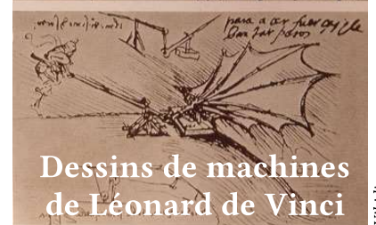
Dessins de machines de Léonard de Vinci