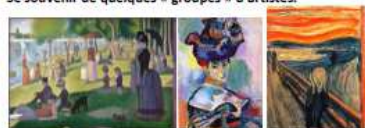
Georges Seurat, Un dimanche après-midi à l'île de la Grande Jatte (1886). Matisse, La femme au chapeau , 1905 Le cri, Edvard Munch, peint entre 1893 et 1917.

Se souvenir de quelques « groupes » d'artistes.