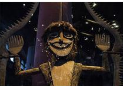
Musée du quai Branly

Ancien château royal devenu l'un des plus grands musées du monde