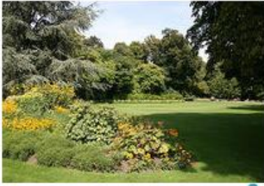
Jardin du Luxembourg

L'un des plus beaux jardins parisiens, romantique à souhait