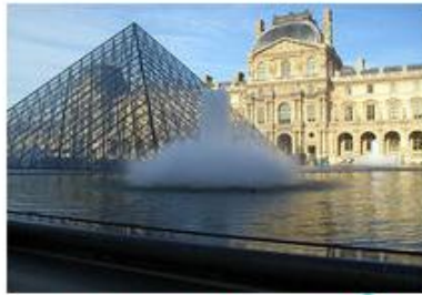
Musée du Louvre

La création artistique de 1848 à 1914, l'un des plus beaux musées du monde