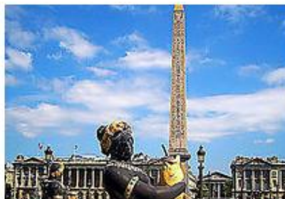
Place de la Concorde

Royaume des arts et civilisations du monde entier