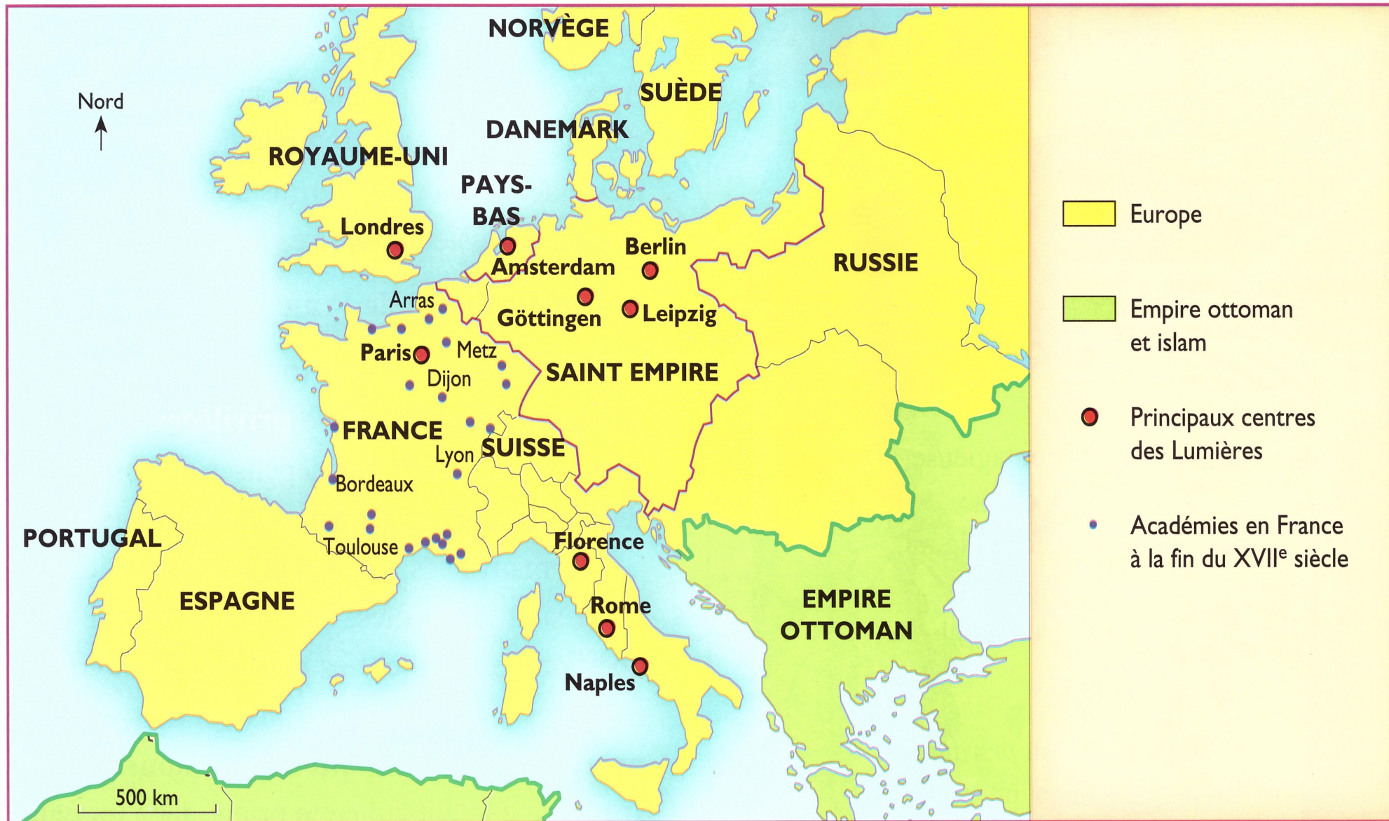
Doc. 1 L'Europe des Lumières