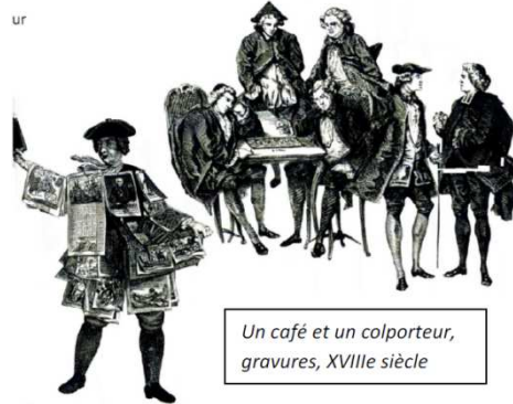
Un café et un colporteur, gravures, XVIIIe siècle