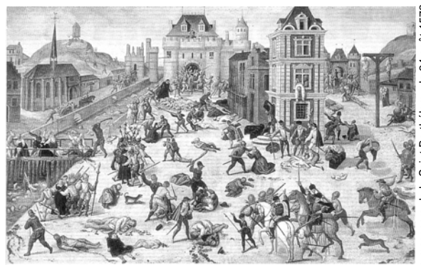
Le massacre de la Saint-Barthélemy, le 24 août 1572.

De 1562 à 1570, une terrible guerre civile (à l'intérieur d'un pays) opposa catholiques et protestants français. Le soir du 24 août 1572, jour de la Saint Barthélemy, le roi Charles IX autorisa l'exécution des chefs protestants : la nuit fut si sanglante qu'elle est appelée " massacre de la Saint-Barthélemy ".