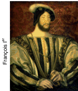
François I er

François I er est roi de France de 1515 à 1547. La France connaît alors une période de grandeur.