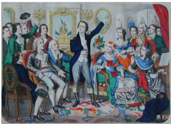
Rouget de Lisle chante « La Marseillaise » pour la 1 ère fois dans un salon strasbourgeois le 7 juillet 1792.

Ce chant guerrier qui devait donner du courage aux soldats devint l'hymne national de la France le 14 juillet 1795. On l'appela « La Marseillaise » parce qu'un médecin la chanta la 1 ère fois à Marseille devant des troupes qui allaient partir sur le front.