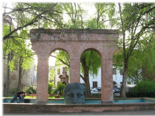
La Fontaine de Janus à Strasbourg