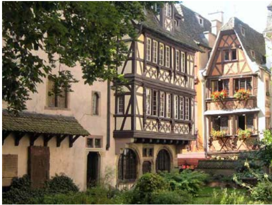
Le jardin gothique du musée de l'Œuvre_Notre-Dame