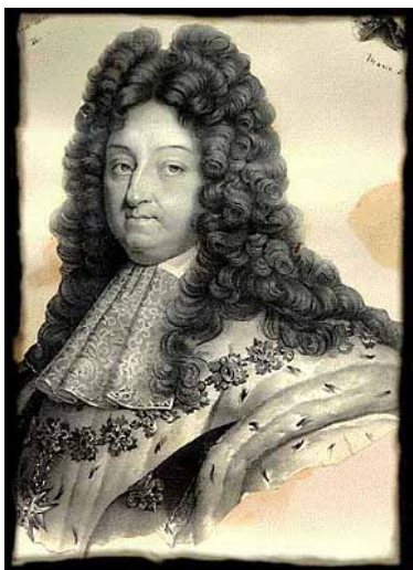
Le roi Louis XIV