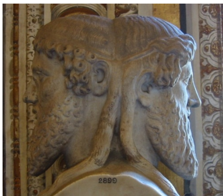
Buste romain de Janus au Musée du Vatican

Janus était un dieu romain veillant sur les ouvertures. Il gardait les portes du ciel et du Domaine des Dieux. Il est représenté avec deux visages, l'un tourné vers le passé et l'autre vers le futur.