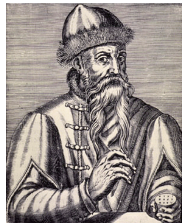
Portrait de Gutenberg