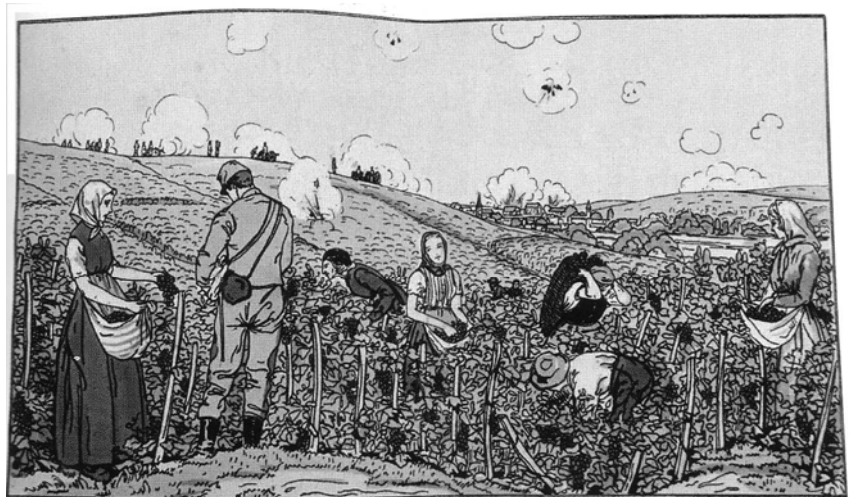
Les vendanges de 1914, gravure.