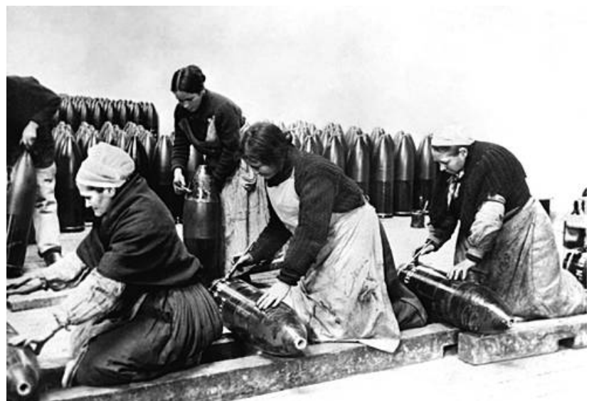
Bretonnes travaillant dans une usine d'armement, photo de 1916.