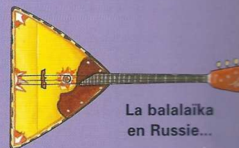
La balalaïka en Russie...