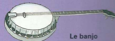
Le banjo en Amérique du Nord...