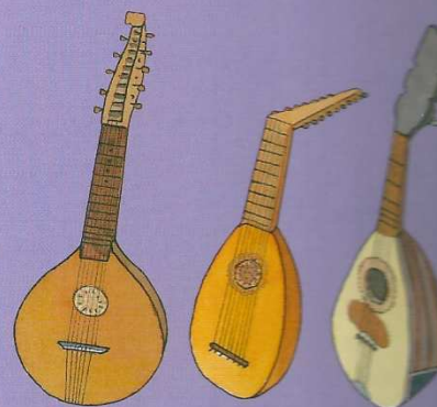
Le cistre, le luth et la mandoline en Europe...