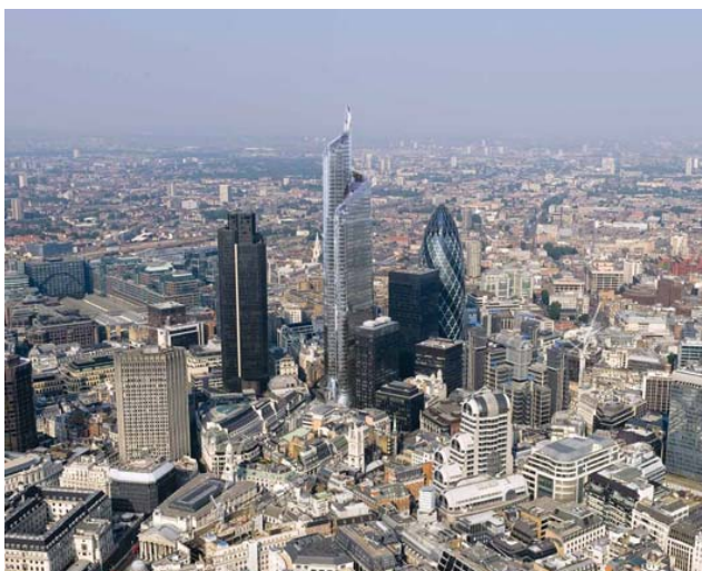
Quartier de la City, Londres.