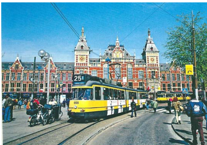
Le tramway d'Amsterdam (Pays-Bas).