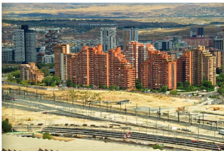
Quartier de Madrid