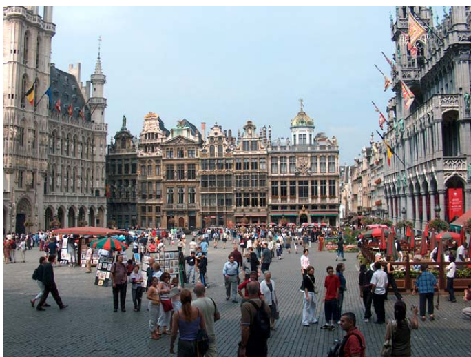
Grand- Place, Bruxelles