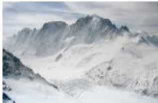
Vallée dans les Pyrénées