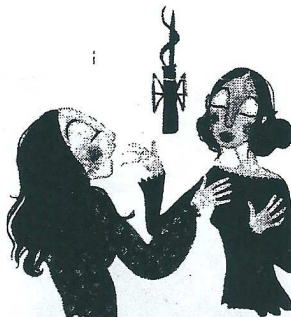
Le chant (en manouche) 15