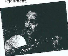
Flamenco andalou Apparu en Andalousie dans les quartiers gitans, le flamenco fait entendre des lamentations profondes et bouleversantes d'hommes et de femmes accompagnés de guitares et de palmas.