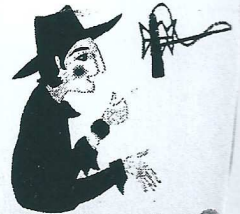
Le narrateur 20

Nous avons écouté des chansons manouches de Django Reinhardt : Mer Djina, Les yeux noirs et Minor Swing.