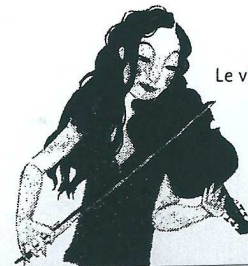
Le violon 18