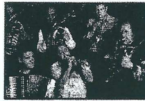
Fanfares rom Ces orchestres, composés principalement de cuivres et de percussions, sont probablement un héritage de musique militaire. Ces fanfares se rencontrent principalement en Macédoine et en Bulgarie.

Jazz manouche en France Le jazz manouche est l'héritage laissé par le génial guitariste Django Reinhardt (1910-1953) : une rencontre étonnante entre le swing américain, la musette et le classique. Les Manouches se font aussi une spécialité de réinterpréter la musique populaire des pays où ils séjournent.