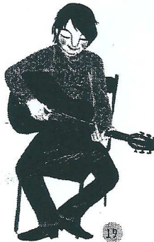
Les guitares manouches