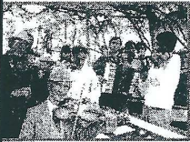
Les tarafs d'Europe de l'Est Les musiciens hongrois, roumains ou russes forment de petits orchestres – les tarafs – qui animent soirées, mariages et enterrements.

Qu'ils soient Gitans, Manouches ou Tsiganes, les Rom (c'est le terme qui les désigne tous) ont en commun de lointaines racines indiennes. Mais au fil de leurs voyages, ils ont adopté et adapté la musique, la langue et les instruments des pays traversés. La musique rom a donc mille facettes mais un même don : celui d'exprimer les émotions les plus contrastées.