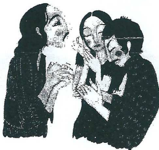
Les palmas 14