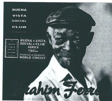
La salsa de Cuba