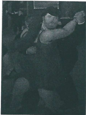
Les pas du tango de l'artiste argentin Fernando Botero.