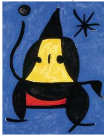
Sans titre (1978)