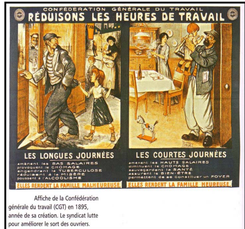
Affiche de la Confédération générale du travail (CGT) en 1895, année de sa création. Le syndicat lutte pour améliorer le sort des ouvriers.