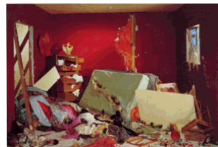
Jeff Wall: "red wall"

Vocabulaire : mise en scène, indices, événement, espace, lieu, lisibilité