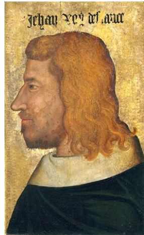
Jean II le Bon, roi de France