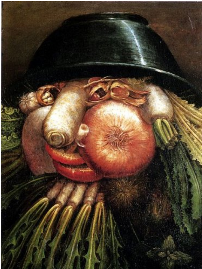
L'homme- Potager, Arcimboldo (1590)