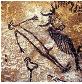
Grotte de Lascaux