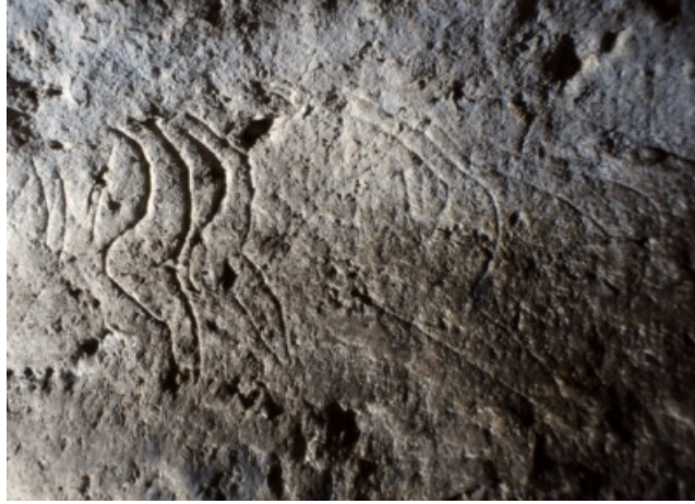
Grotte de Fronsac (fig. féminines)