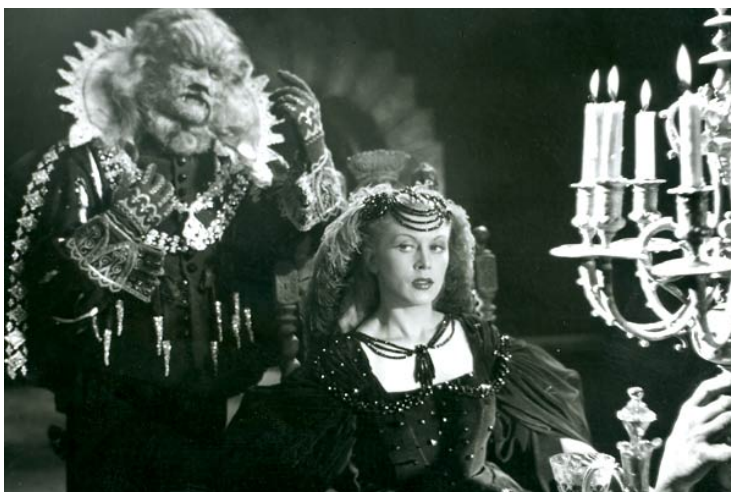
La Belle et la Bête, film de Jean Cocteau (1946)