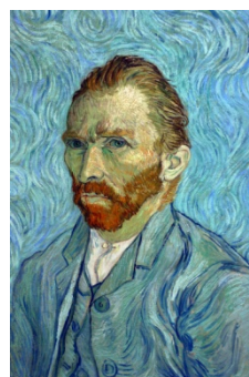
Autoportrait de Van Gogh (1889)

« Les Poires », Honoré Daumier, 1808- 1879, transformation caricaturale parue dans le journal La Caricature en 1831.