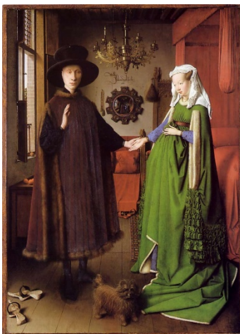
Les époux Arnolfini, Jan Van Eyck (1434)