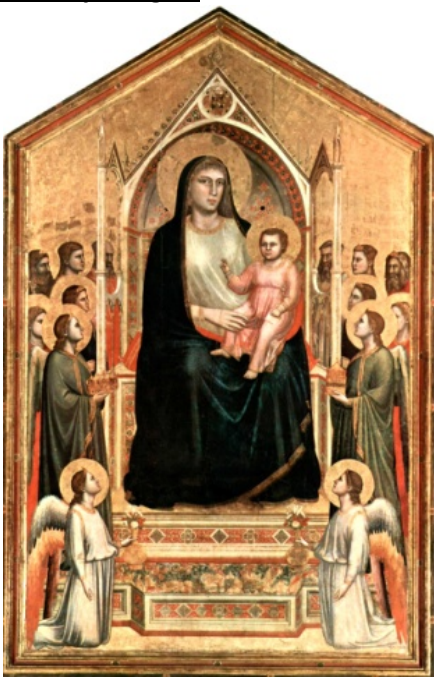
Madone d'Ognissanti de Giotto (1300), Florence