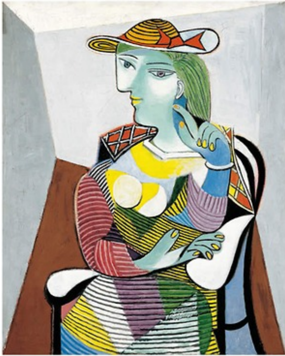
Portrait de Marie- Thérèse, Picasso (1937)