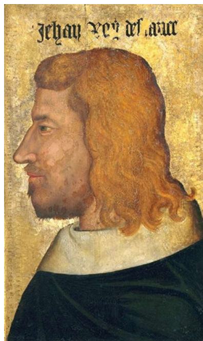
Jehan 2e des francs Jean II le Bon, roi de France Anonyme