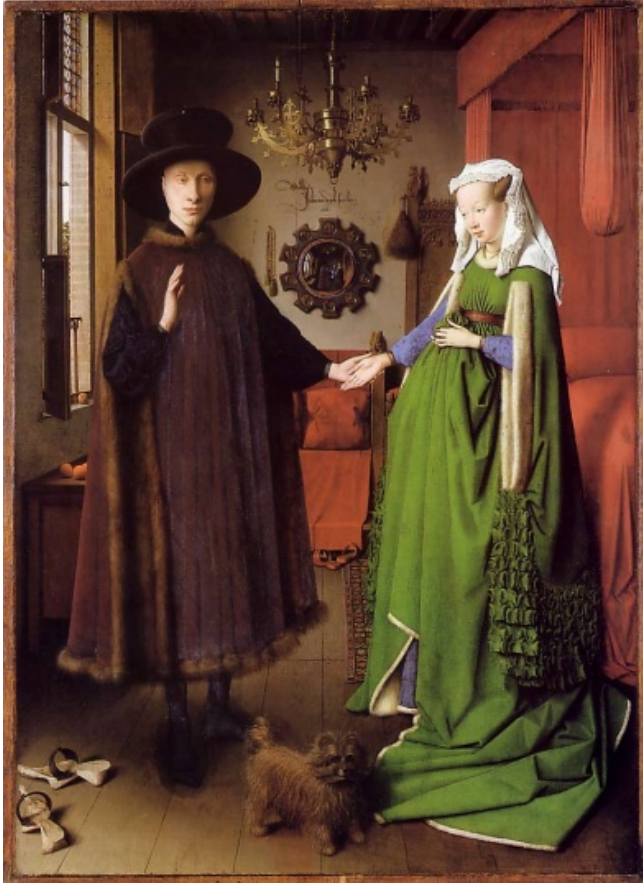
Les époux Arnolfini, Jan Van Eyck (1434)