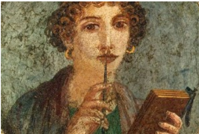
Peinture murale, Pompéi (Italie)