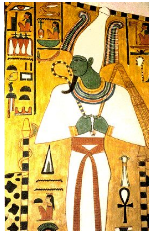
Dieu égyptien Osiris