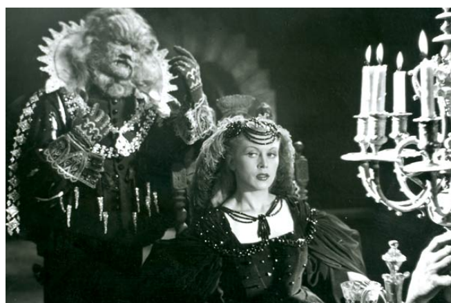
La Belle et la Bête, film de Jean Cocteau (1946)