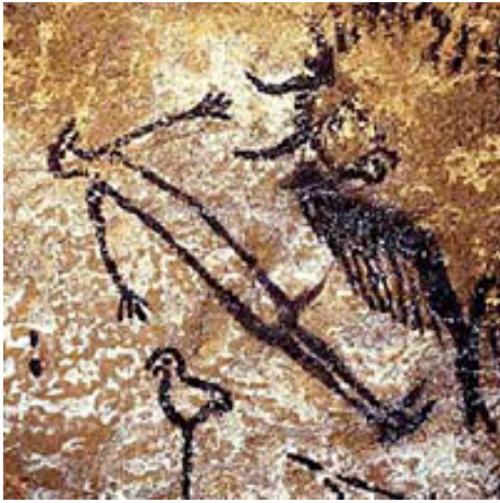
Grotte de Lascaux