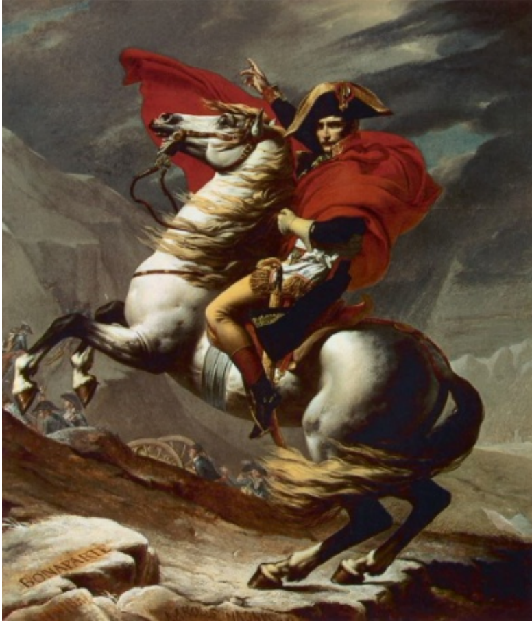
Napoléon traverse les Alpes, David (1800)