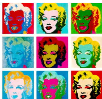
Marilyn Monroe (1967), Andy Warhol