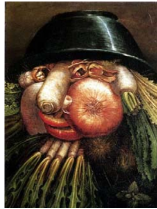
L'homme- Potager, Arcimboldo (1590)