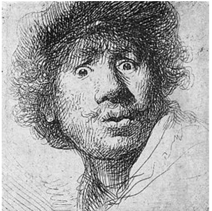
Autoportrait : Rembrandt aux yeux hagards (1630).