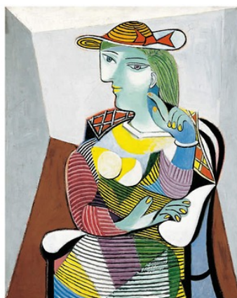
Portrait de Marie- Thérèse Picasso (1937)