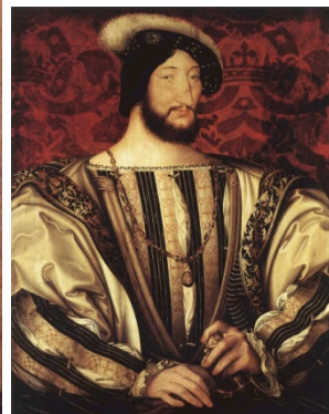
François 1 er roi de France Jean Clouet (1527) Musée du Louvres