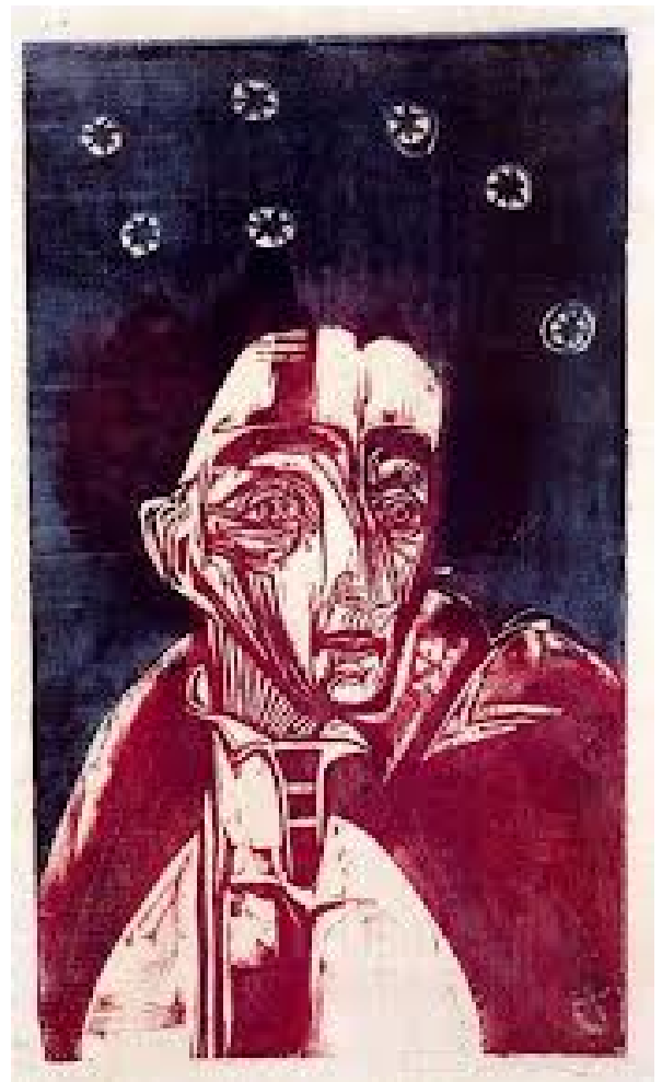
Femme dans la nuit, Kirchner (1880- 1938)