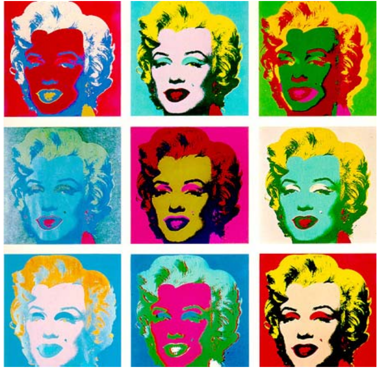
Marylin Monroe (1967), Andy Warhol