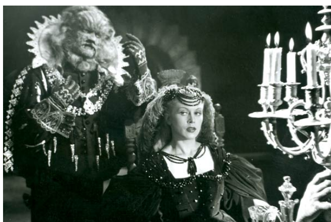
La Belle et la Bête, film de Jean Cocteau (1946)