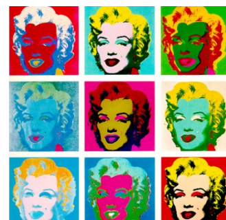
Marilyn Monroe (1967), Andy Warhol