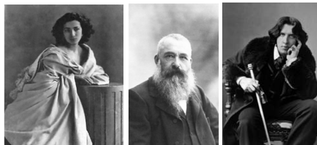
Portraits de Sarah Bernhardt, Monnet et Baudelaire (comédienne) (peintre) (poète)