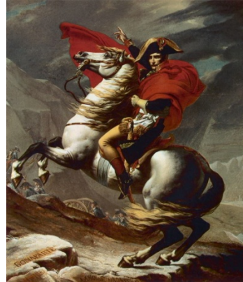
Napoléon traverse les Alpes, David (1800)