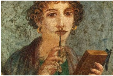
Peinture murale, Pompéi (Italie)