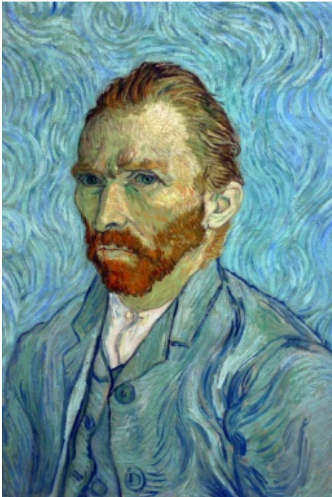
Autoportrait de Van Gogh (1889)