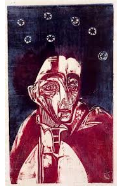
Femme dans la nuit, Kirchner (1880- 1938)