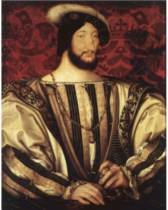
François 1 er roi de France, Jean Clouet (1527), Au Louvres