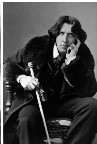
Portrait de Baudelaire (poète)