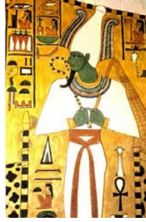
Dieu égyptien Osiris