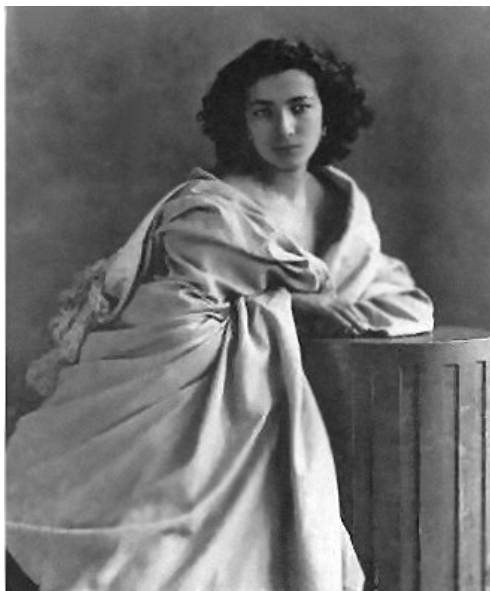
Portraits de Sarah Bernhardt (comédienne)