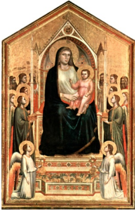
Madone d'Ognissanti de Giotto (1300), Florence