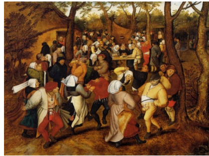
Bruegel le Jeune, Danse de noc en plein air