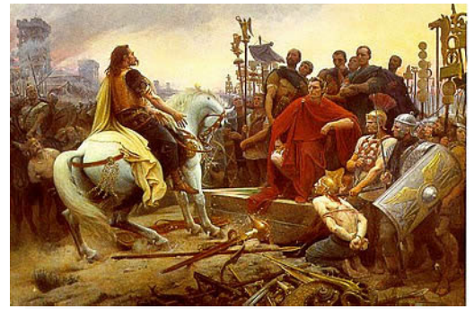
Vercingétorix jette ses armes aux pieds de César, Royer, 1899.