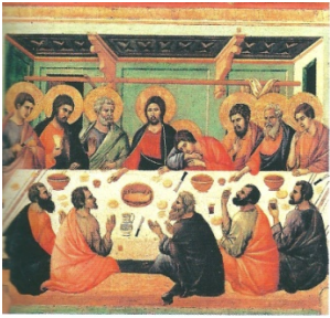
Duccio, Cène de la Maesta, 1301-1308. Peinture sur bois.