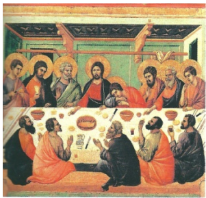
Duccio, Cène de la Maesta, 1301-1308. Peinture sur bois.