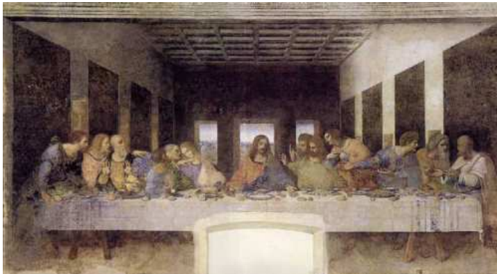
La Cène , Léonard de Vinci, au réfectoire de l'église Sainte-Marie-des-Grâces à Milan.

4. Explique de quoi parle ce tableau de Léonard de Vinci.