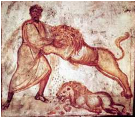
Dessin pris en photo dans des catacombes à Rome (cimetière sous-terrain).

Conception : Gilles Zipper, septembre 2014 (merci de citer vos sources)