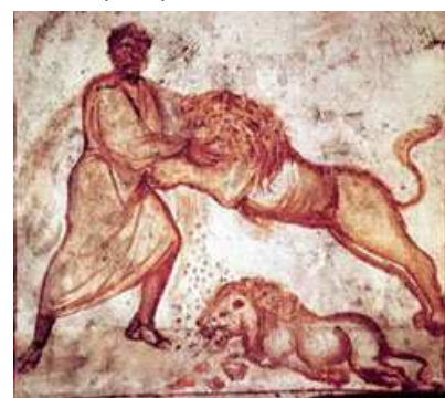
Dessin pris en photo dans des catacombes à Rome (cimetière sous-terrain).

Conception : Gilles Zipper, septembre 2014 (merci de citer vos sources)