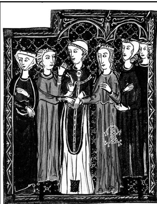
▲ Doc. 2 : Enluminure de mariage chrétien au XIII e siècle.