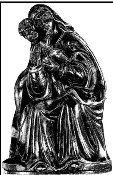
▲ Doc. 1 : Statue de Notre-Dame-du-Port (Puy-de-Dôme). La Vierge a toujours été honorée par les chrétiens. Elle est représentée en général avec son fils sur les genoux ou dans ses bras. La Vierge et l'Enfant sont souvent noirs.