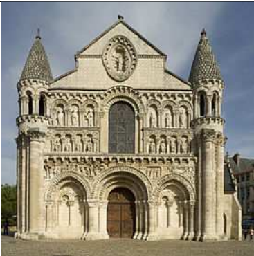
Eglise de Poitiers.

2. Pour chaque église, complète le tableau en dessous.