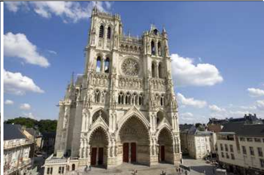
Cathédrale de Grenoble