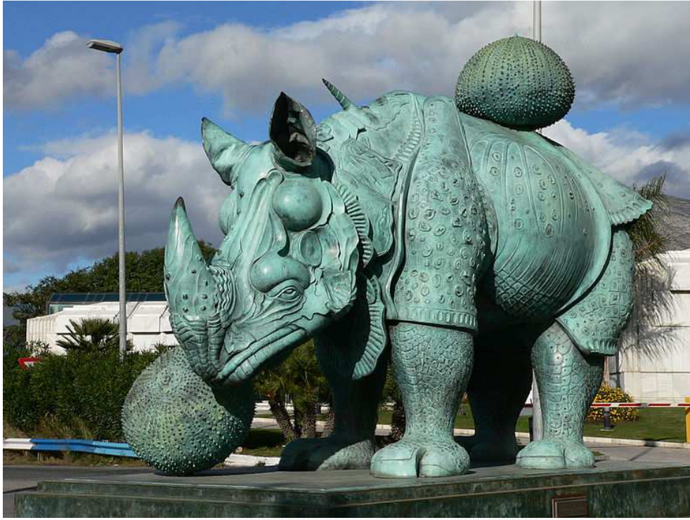
Salvador Dali (1904 – 1989), Statue monumentale du Rhinocéros habillé de dentelles à Puerto Banús (Sud de l'Espagne), inspiré du Rhinocéros de Dürer.