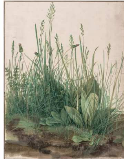
Dürer, La grande touffe d'herbe, 1503, dessin à l'aquarelle et à la gouache.