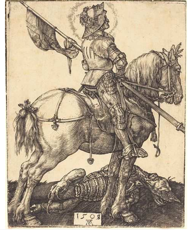
Albrecht Dürer, St George à cheval, gravure, 1508.