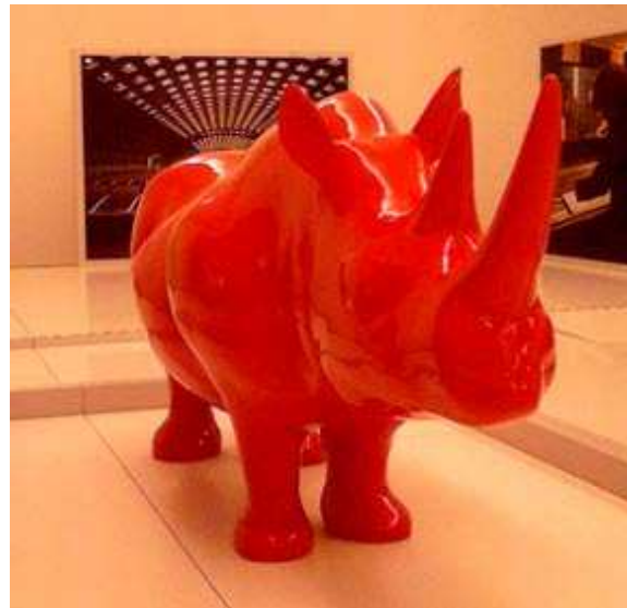
Xavier Veilhan - Le Rhinocéros, 1963