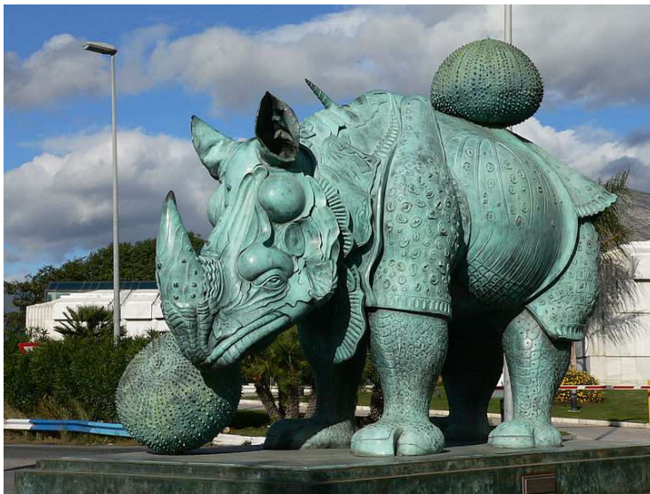
Salvador Dali (1904 – 1989), Statue monumentale du Rhinocéros habillé de dentelles à Puerto Banús (Sud de l'Espagne)