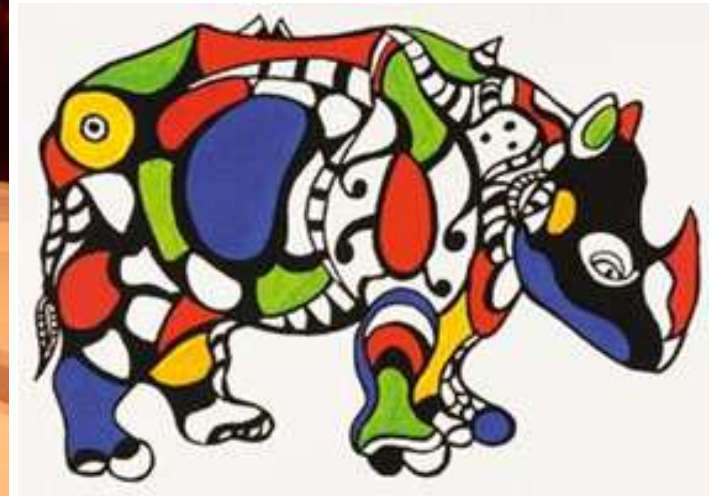
Niki de Saint Phalle, Rhino, 1999.