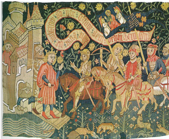
Arrivée de Jeanne d'Arc à Chinon (tapisserie de Nuremberg, fin du XV e siècle). Jeanne rencontre le roi Charles VII le 25 février 1429. Elle réussit à le convaincre de se faire sacrer à Reims.