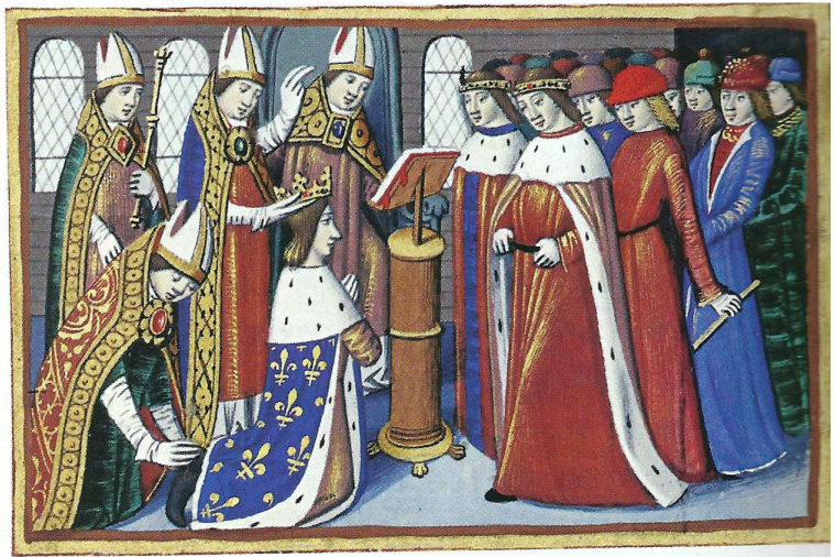
Le sacre du roi Charles VII, 17 juillet 1429 (miniature du xv e siècle).