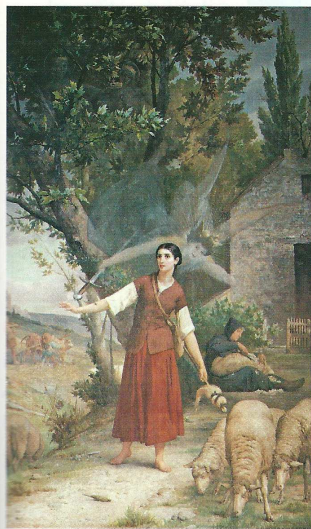
Jeanne d'Arc gardant ses moutons (tableau du XIX e siècle).