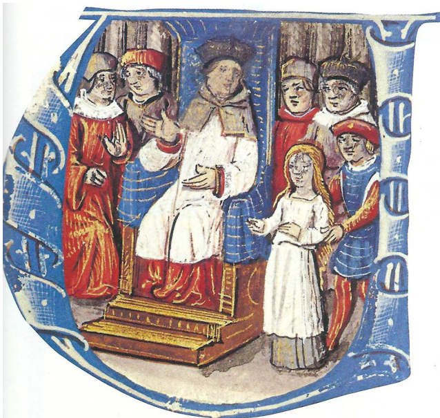
Le procès de Jeanne d'Arc, janvier-mai 1431 (manuscrit du xv e siècle).