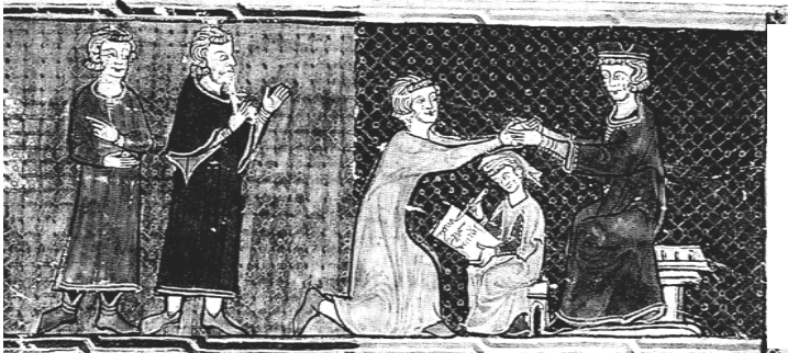
Cérémonie, scène d'hommage au roi de France en 1304. Miniature (dessin illustrant un livre) pris dans le livre « Les grandes Chroniques de France », vers 1400.