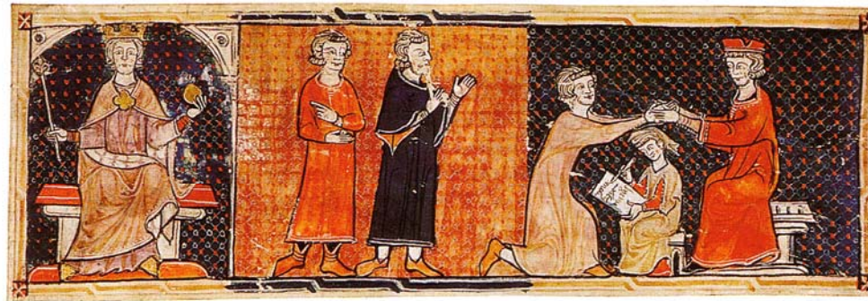
Scène d'hommage au roi de France en 1304. Miniature, Les Grandes Chroniques de France , vers 1400.