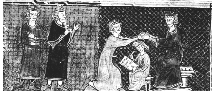
Cérémonie, scène d'hommage au roi de France en 1304. Miniature (dessin illustrant un livre) pris dans le livre « Les grandes Chroniques de France », vers 1400.