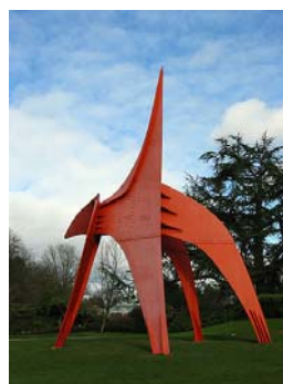
L'aigle, sculpture stable tôle et boulons peints, musée de Seattle, 1967, env. 20 m