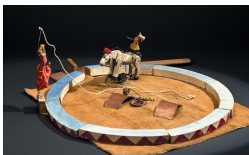
Cirque Calder, un détail, 1926 – 1931.

Conception : Gilles Zipper, décembre 2015 (merci de citer vos sources)