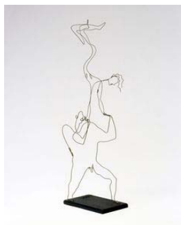
Deux acrobates, 1929.