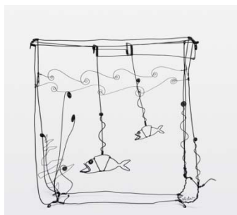
Bocal de poissons rouges, 1929 (41x38x15 cm New York, foundation Calder)