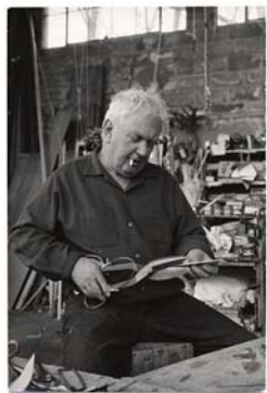
Calder, dans son atelier.