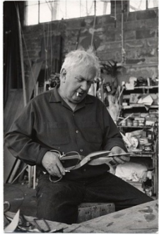
Calder, dans son atelier.