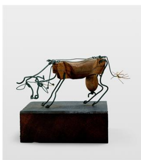
Vache, 1926. (fil de fer, bois et ficelle)