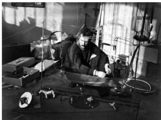
Calder travaillant à son cirque, 1927.