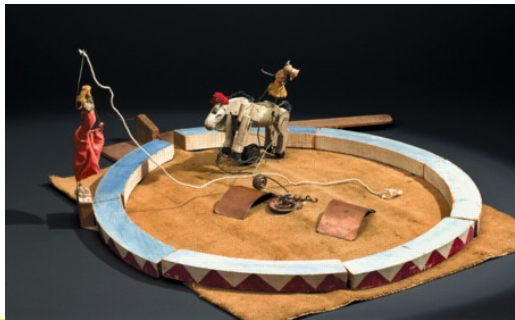
Cirque Calder, un détail, 1926 – 1931. https://www.youtube.com/watch?v=iG6cP2VA0Bg