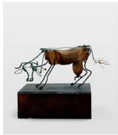
Vache, 1926. (fil de fer, bois et ficelle New York, Museum of Modern Art)