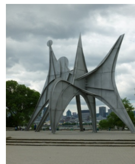
L'homme, 1967, Montréal, sculpture stable, acier inoxydable et boulons, 20m