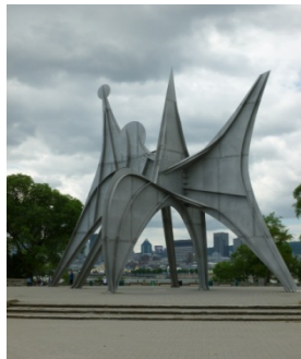
L'homme, 1967, Montréal, sculpture stable, acier inoxydable et boulons, 20m