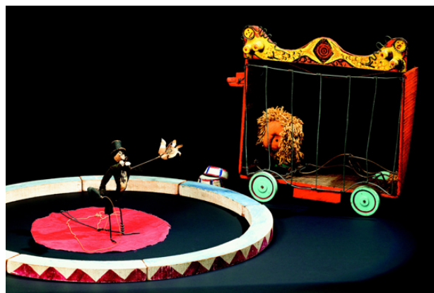
Cirque Calder, un détail, 1926 – 1931.