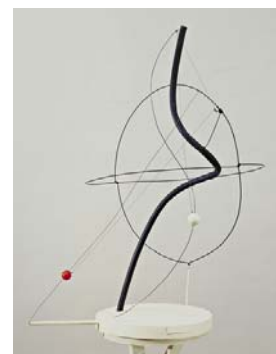
Un univers, 1934, mobile à moteur 102 x 78 x 73, New York, Museum of Modern Art