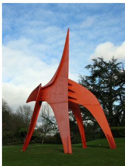
L'aigle, sculpture stable tôle et boulons peints, musée de Seattle, 1967, env. 20 m