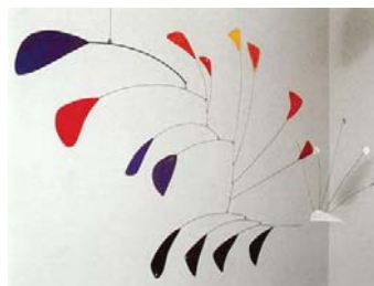
Paon, 1941 93 x 126 cm Collection particulière