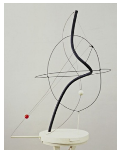
Un univers, 1934, mobile à moteur 102 x 78 x 73, New York, Museum of Modern Art