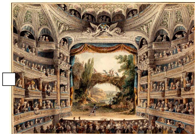
Salle de la Comédie-Française au XVIII e siècle.