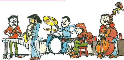
Formation du "Modern jazz quartet" : vibraphone, saxo-alto, batterie, guitare basse et contrebasse.