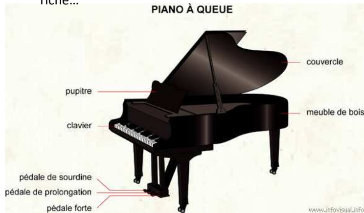
PIANO À QUEUE