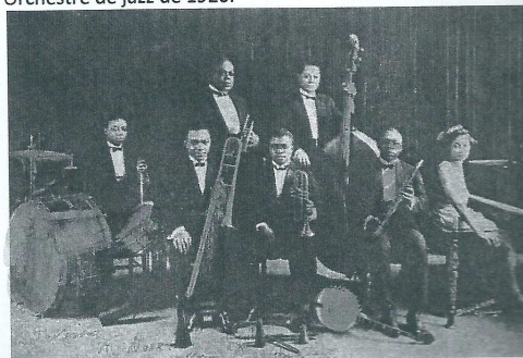
batterie – trombone à coulisse – trompette – contrebasse – clarinette – banjo...