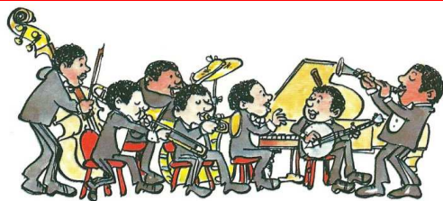
Orchestre de jazz traditionnel : au premier plan : trompette, clarinette et trombone. A la section rythmique : contrebasse, piano, banjo et batterie.