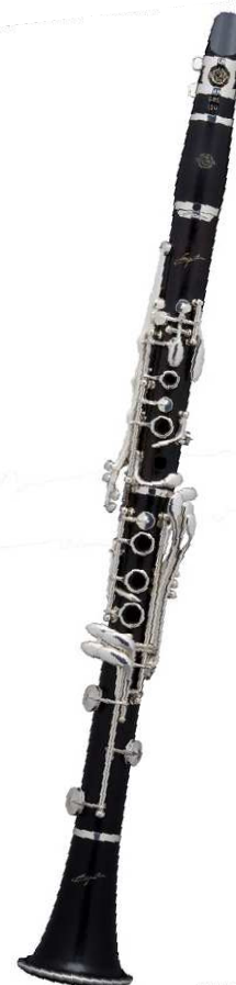
Soprano courbe ou droit