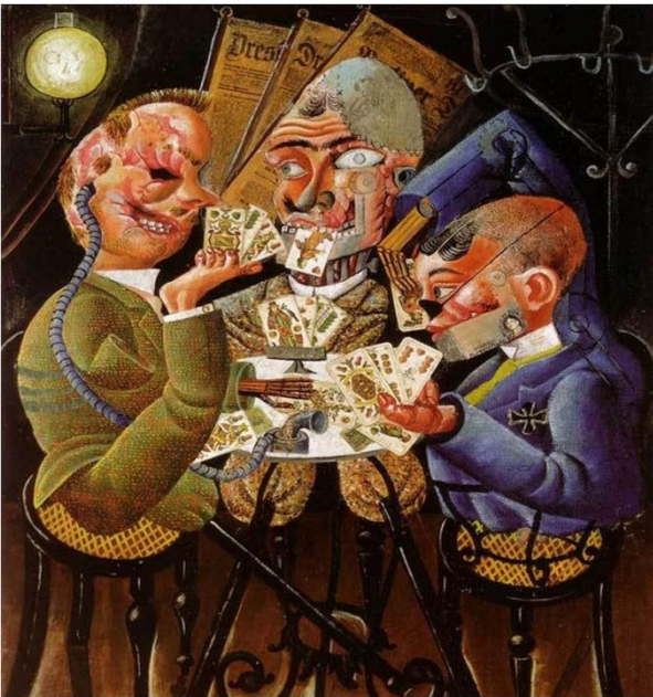
Otto Dix (1891-1969), Les joueurs de skat, 1920, 110X87 cm, Huile sur toile et collages Galerie Nationale de Berlin.

Otto Dix montre les « gueules cassées » pour critiquer la guerre.