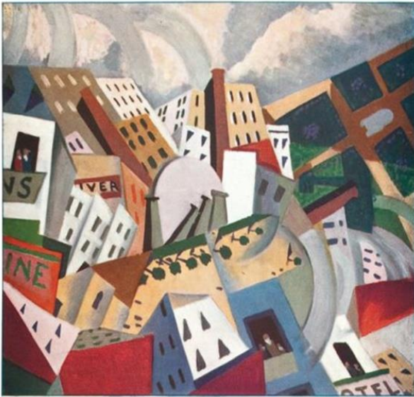
Edouard Garcia Benito -illustration de « Dans le ciel de La patrie » - 1918