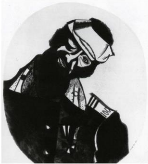
Marc Chagall – Le soldat blessé - 1914

Marc Chagall témoigne de la violence de la guerre.