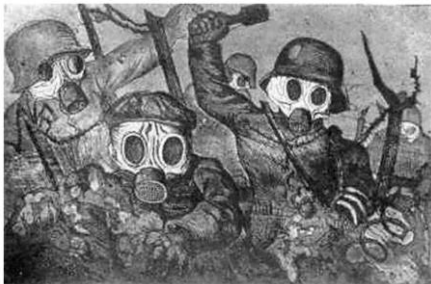
Otto Dix – Assaut sous les gaz - 1924

L'allemand Otto Dix critique la sauvagerie des hommes.