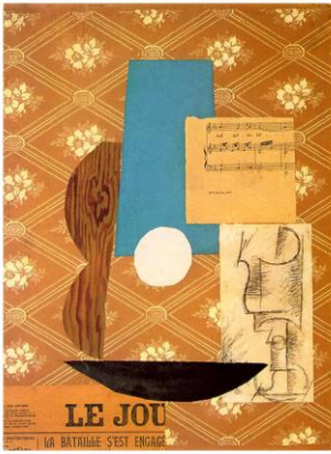
Pablo Picasso – Nature morte à la guitare - 1912