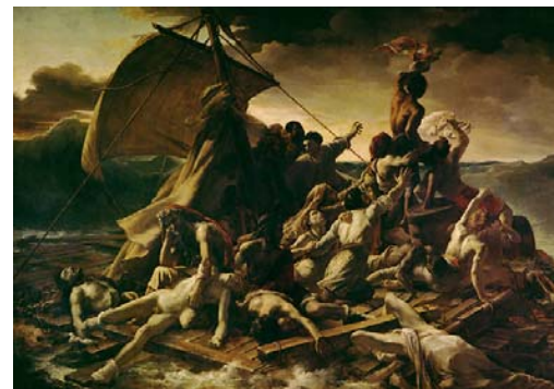
Tableau 2 :