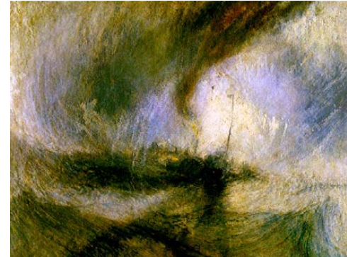
Tableau 1 :

c) Enfin explique ce qu'ont voulu nous faire comprendre ou ressentir les peintres grâce à ces compositions.