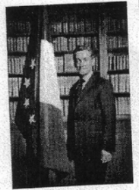
le général de gaulle