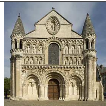
Eglise de Poitiers.

2. Pour chaque église, complète le tableau en dessous.