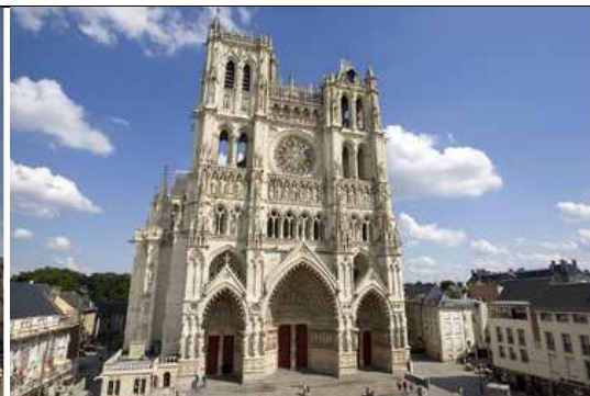
Cathédrale de Grenoble