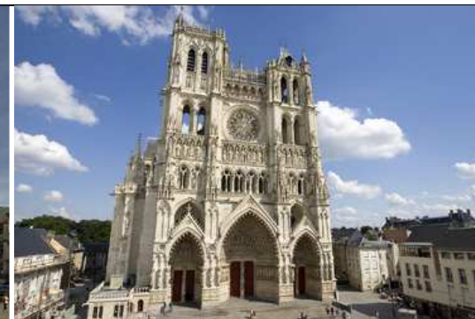
Cathédrale de Grenoble