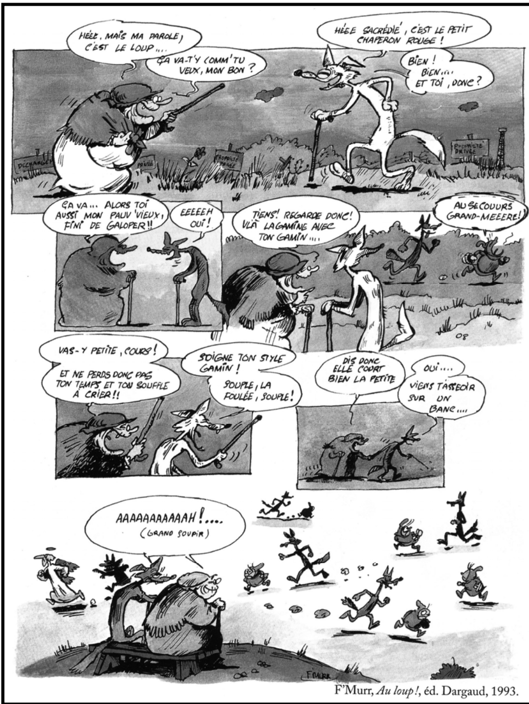
F'Murr, Au loup! , éd. Dargaud, 1993.