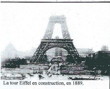
La tour Eiffel en construction, en 1889.

Paris se modernise et les autres villes de France la copient.