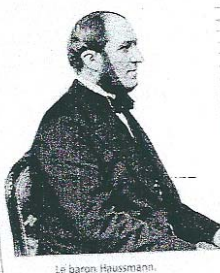
Le baron Haussmann.