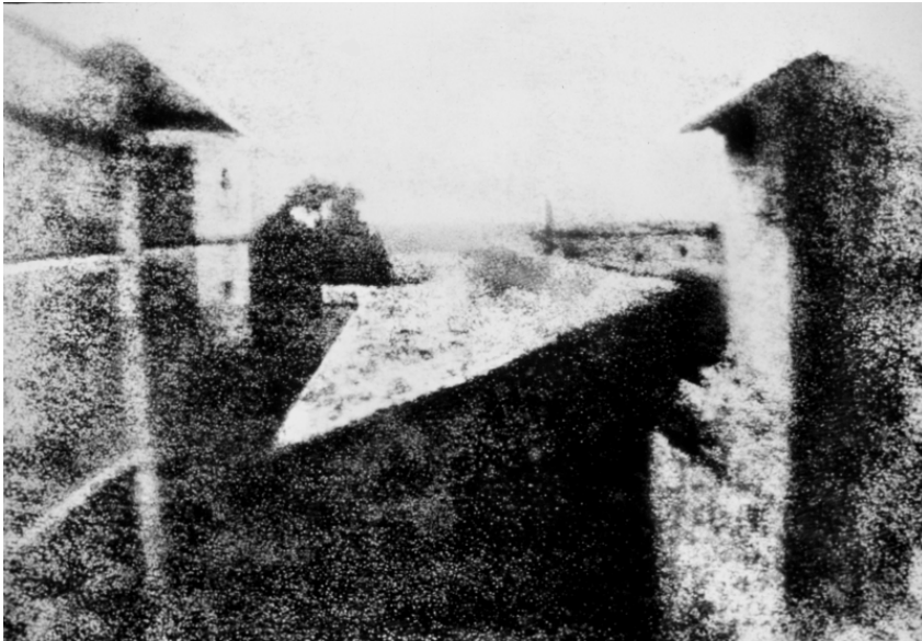
Point de vue pris d'une fenêtre du Gras à Saint-Loup-de-Varennnes (vers 1826 – 1827), Joseph Nicéphore Niépce (1765 – 1833)