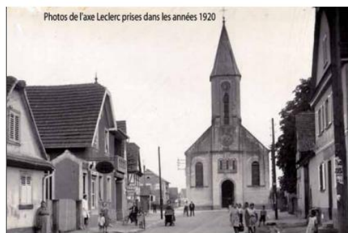
Photos de l'axe Leclerc prises dans les années 1920

Grâce à des photos pris à différentes époques, on peut rendre plus visible l'évolution des aménagements rendus nécessaires par l'utilisation de moyens de transports différents : en 1920, on marche au milieu de la rue...