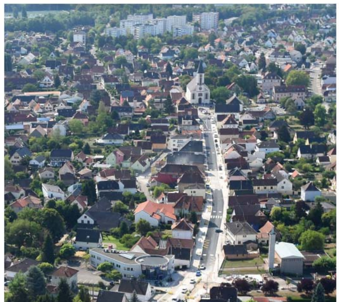
Photo aérienne d'Ostwald, rue du Maréchal Foch