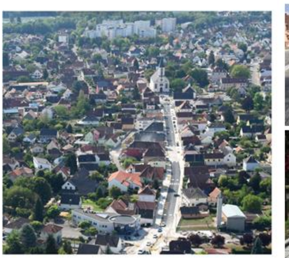
Photo aérienne d'Ostwald, rue du Général Leclerc, 2016.