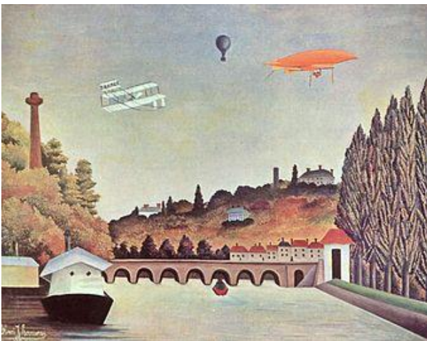
“Vue du Pont de Sèvres”

“Vue du Pont de Sèvres” (à Paris), il y a plus de 100 ans, en 1908. Le peintre représentait ce qu'il voyait, donc aussi les nouveautés de l'époque : regarde ce que tu vois dans le ciel ! Ces engins existaient à cette époque (montgolfière, avion, dirigeable). Aujourd'hui, c'est un quartier d'affaires, à Paris.